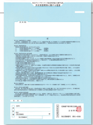
共有馬管理等に関する覚書 【地方入厩予定馬用】

馬名 XXXXXXXXXXXXXXXの18 2018年9月9日生 牡 鹿毛 父 XXXXXXXXXXXXXXX 母 XXXXXXXXXXXXXXX 共有持分の20分の1